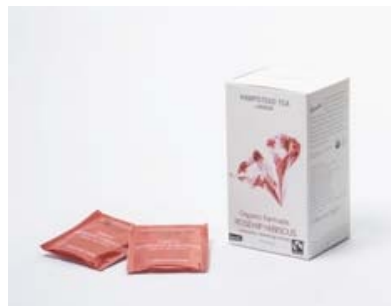
Ibiškový čaj, 20 sáčků