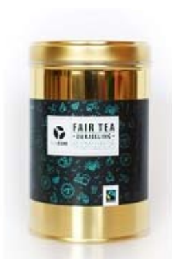
Sypaný černý Darjeeling

Černé, zelené, bylinkové ... to vše pro vás máme. Neváhejte a vyberte si horký nápoj dle svých představ.