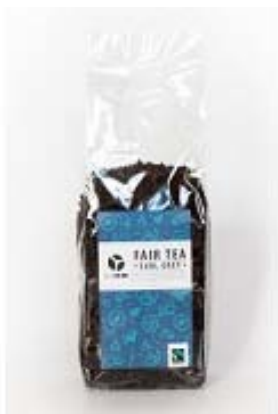
Sypaný černý Earl Grey