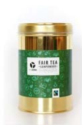
Sypaný zelený Gunpowder