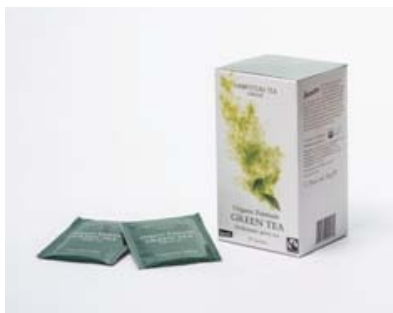
Zelený čaj, 20 sáčků