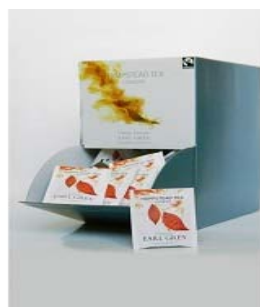
Černý čaj, 250 sáčků