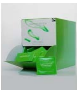
Mátový čaj, 250 sáčků