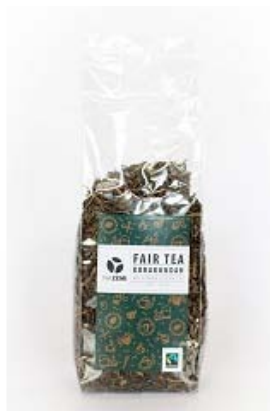
Sypaný zelený Korakundah