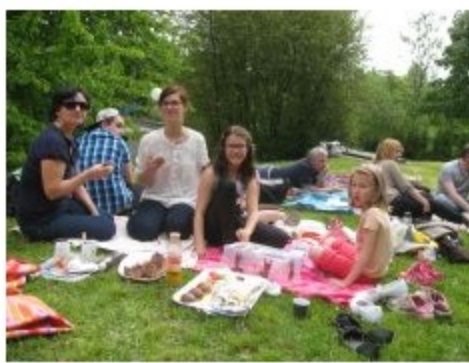
ZŠ Václava Talicha.

Na 137 místech České republiky dalo více než pět tisíc lidí jasně najevo, že je zajímavá, kdo a za jakých podmínek pro ně pěstuje například čaj, kávu nebo zeleninu a ovoce. Stalo se tak na pikniku s názvem Férová snídaně NaZemi , který podporuje fairtradové a lokální pěstitele. V ČR se slavil už popáté, a to již tradičně na Světový den pro fair trade. Absolutně největší počet lidí (200) přišel na férový piknik v Rožnově pod Radhoštěm a v Mostě. Obě Férové snídaně pořádaly tzv. Fairtradové školy a škola, které o tento titul usiluje. V Rožnově to byli žáci ZŠ Pod Skalkou a v Mostě žáci ZŠ Svážná a